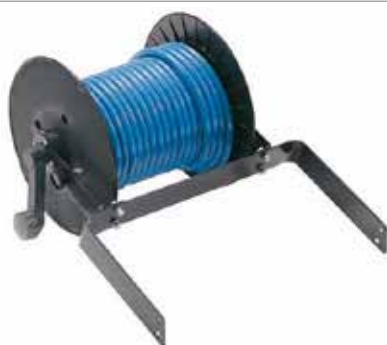
Avvolgitubo in ABS con tubo \varnothing 8 x 16 ( 20 m o 40 m ) ABS hose reel with hose \varnothing 8 x 16 ( 20 m or 40 m ) Enrouleur de tuyau ABS avec tuyau \varnothing 8 x 16 (20 m ou 40 m) Enrollador de manguera ABS con manguera \varnothing 8 x 16 (20 m o 40 m) ABS-Schlauchtrommel mit Schlauch \varnothing 8 x 16 (20 m oder 40 m)

OPTIONAL / OPTIONNEL / OPCIONAL / OPTIONAL