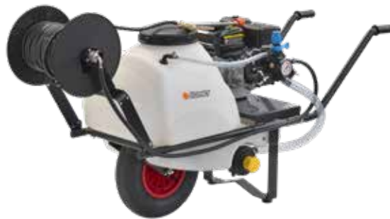
CRRL 80 ECO