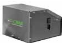
Modulo a batteria Comet Comet battery Module Module à batterie Comet Módulo de batería Comet Comet Batteriemodul

COMET BATTERY MODULE KIT / KIT MODULE À BATTERIE COMET / KIT MODULE DE BATTERIE COMET / KIT MÓDULO DE BATERÍA COMET / COMET BATTERIEMODUL-SET