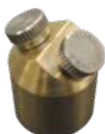
Kit testina portaugelli misting Misting nozzle holder kit Kit porte-buses de brumisation Kit porta boquillas de nebulización Sprühdüsenhalter-Kit