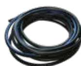
Tubo flessibile da 5 m 5 m flexible hose Tuyau flexible de 5 m Manguera flexible de 5 m 5 m Flexschlauch