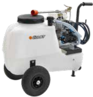
CRRC 50 ECO L