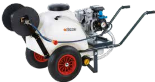
CRRC 81 ECO