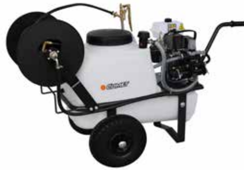
CRRC 51 ECO