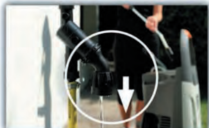
BA10 - Der BackFlow Preventer (Rückflussverhinderer) tritt in Funktion, wenn der Druck im Netz sinkt, dabei wird die Trinkwasserversorgung vom Versorgungsnetz des Hochdruckreinigers isoliert, und das Wasser extern entsorgt.