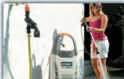
Beim Öffnen des Hahns schließt der Wasserfluss hermetisch das Auslassventil des BA10- BackFlow Preventer (Rückflussverhinderer), das sich wie ein Stück gerades Rohr verhält.