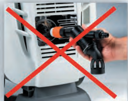
Kann nicht direkt am Hochdruckreiniger angebracht werden