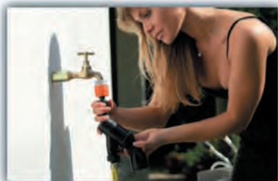
BA10 - Der BackFlow Preventer (Rückflussverhinderer) wird kinderleicht direkt an den Wasserhahn montiert.

Nach aktuellen EU-Richtlinien gilt das Wasser, das durch einen Hochdruckreiniger läuft, nicht mehr als Trinkwasser. Aus diesem Grund können Hochdruckreiniger nicht direkt an die Trinkwasserversorgung angeschlossen werden, ohne vorher den Systemtrenner BA 10 Black Flow Preventer (Rückflussverhinderer) zu installieren.